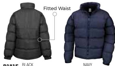
R181F BLACK (BLK)